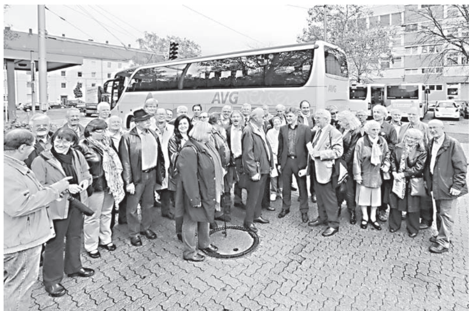
Mit 2 Bussen geht es los zur Infofahrt durch den Osten von Karlsruhe.